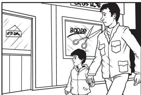
1. Odlazak u salon