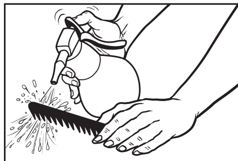
7. Kvašenje kose