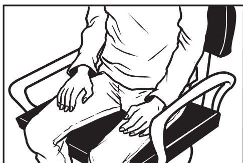
5. Stavljanje ruku u krilo