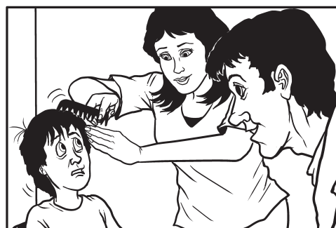
8. Češljanje kose