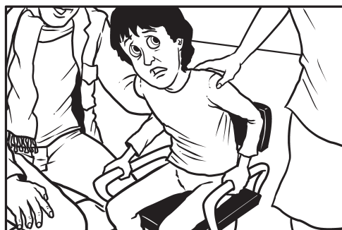
4. Smeštanje u stolicu