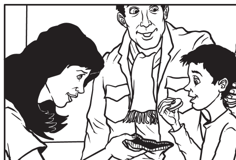
10. Nagrada za izvršen zadatak