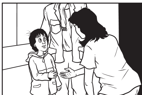
3. Susret sa sa frizerom